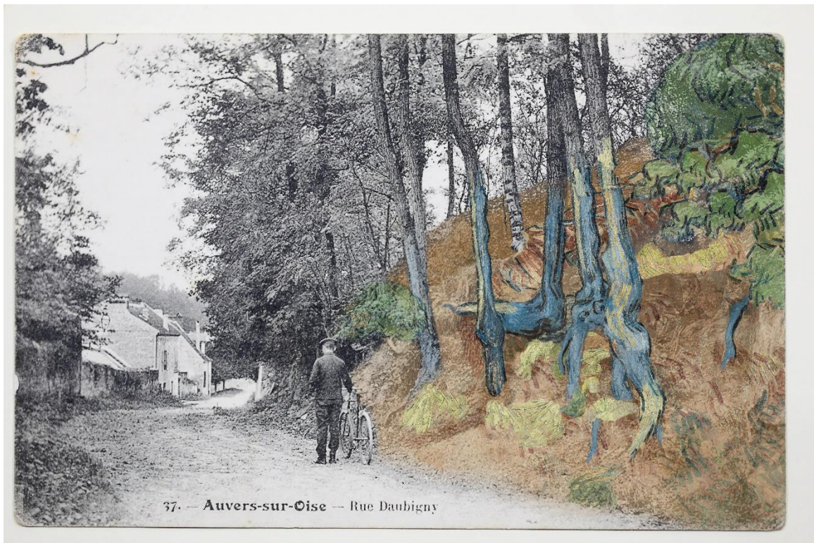
Ansichtkaart 'rue Daubigny, Auvers-sur-Oise' met daar overheen het schilderij Boomwortels (1890) van Van Gogh

De mensen die jaarlijks in Auvers in de voetstappen van Vincent van Gogh komen treden, zullen vanaf vandaag een ontroerende ervaring kunnen toevoegen aan hun bezoek; ze kunnen op de exacte plek gaan staan waar van Goghs penselen voor het laatst het doek hebben geraakt.